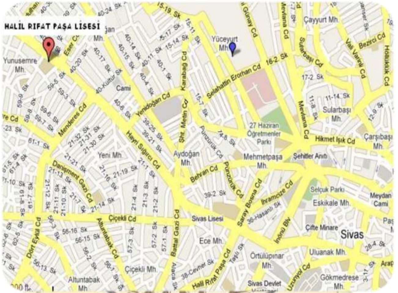
Halil Rifat Paşa Lisesi Lokalizasyon Haritası